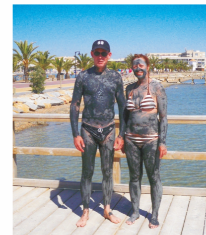
Heilschlamm aus dem Meer: In Lo Pagan reiben sich viele Badegäste von Kopf bis Fuß mit dem schwarzen Schlick ein.

Rings um das Mar Menor finden Sie eine moderne Infrastruktur mit Hotel- und